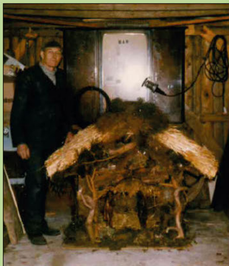
1983 – Herr Schwarze veränderte noch einmal die Höhe der Krippe