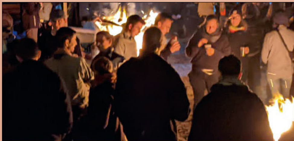
Auf dem Bundeshof beim Bundesthing am 13. bis 14. November