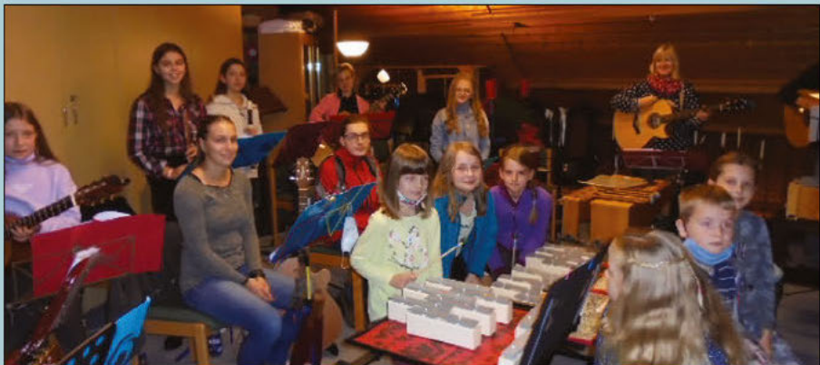
Die neue Xylophongruppe