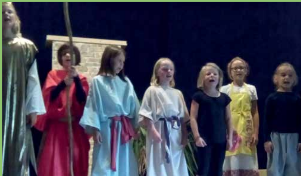
Aufführung Kindermusical „Mose – ein echt cooler Retter“

Am 3. November ging es in der Kinderkirche in Hoya um Barmigkeit.