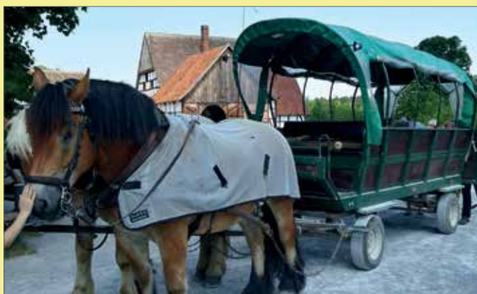
Ausflug am 23. Juni zum Freilichtmuseum Detmold und zur Adlerwarte Berlebeck