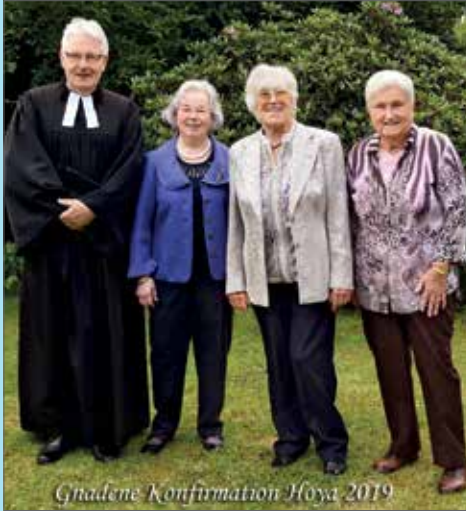
Ghadene Konfirmation Hoya 2019