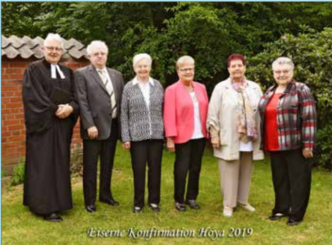
Eiserne Konfirmation Hoya 2019