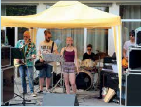
Gemeindefest am 26. Juni