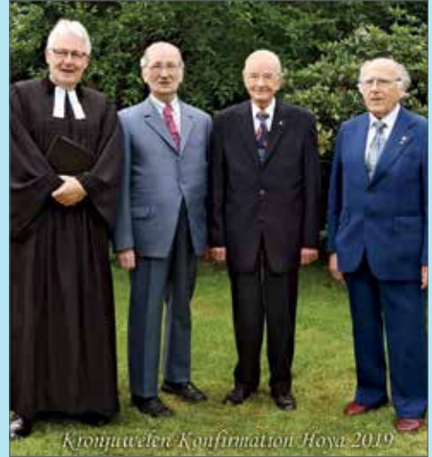
Kronjuwelen Konfirmation Hoya 2019