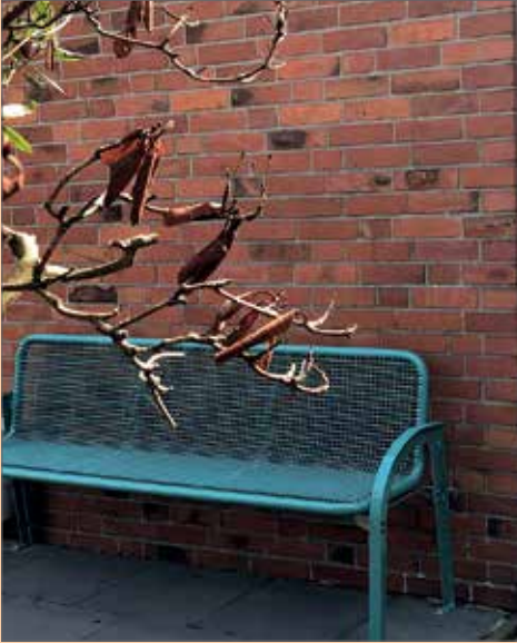
Die Bank vor dem Haupteingang